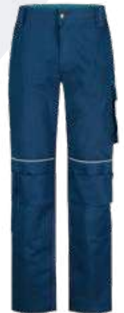
PX0420 Pantaloni da lavoro