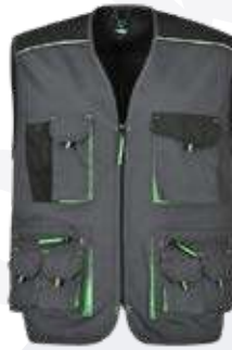
PX0904 Gilet da lavoro