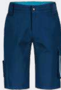
PX0421 Shorts da lavoro