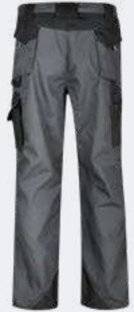
PX0406 Pantaloni da lavoro